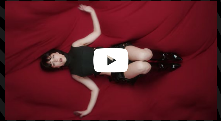
Video oficial de Hush en YouTube